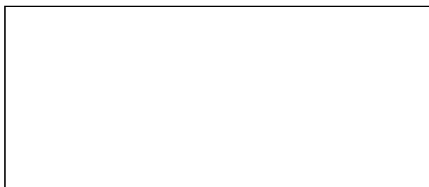
Схема границ эксплуатационной ответственности сторон

Прочие сведения по установлению границ раздела эксплуатационной ответственности сторон _____